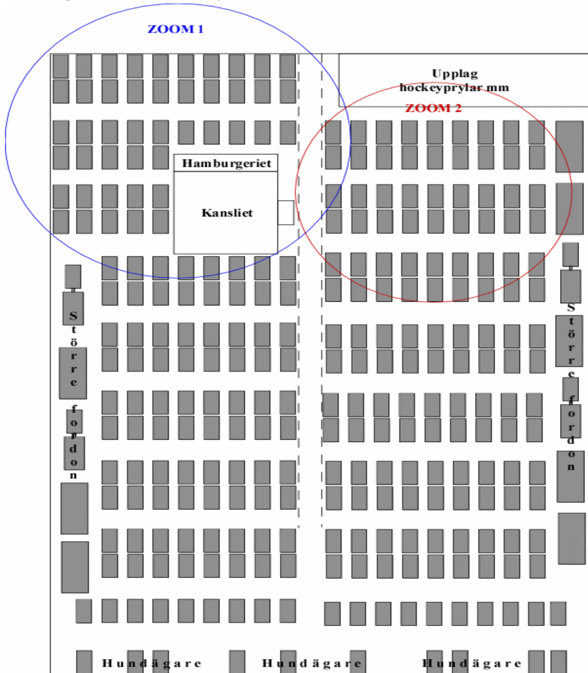
Figur 1. Principiell placering av bilar på fotbollsplanen. Zoom 1 och 2 redovisas i Figur 2 och 3.